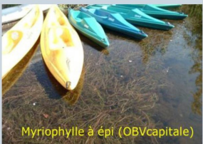
Myriophylle à épi (OBVcapitale)